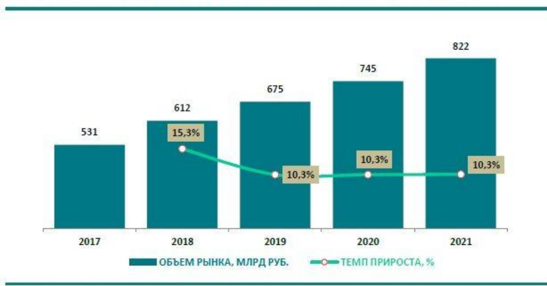
Ris. 12. Динамика и прогноз российского рынка бизнес-тревел, млрд руб.

I 2018, vokste det russiske MICE-markedet med 15,3 % og utgjorde 612 milliarder rubler. De fleste kunder er fra offentlig sektor. Den største delen av markedet er ikke bearbejdet av byråene i det hele tatt. Topp 10 byråene står for 15,4 % av markedet — og dette tallet vil øke til 23,8 % i 2021. Disse resultatene ble presentert av RBC analytikere før Koronakrisen inntraff.