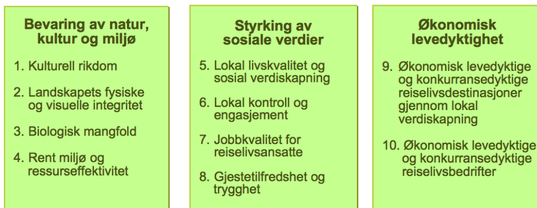
Modell 1) De 10 prinsipper for bærekraftig reiseliv

Basert på de tre dimensjonene av bærekraftig reiselivsutvikling; økonomisk, sosialt og miljømessig, har Innovasjon Norge formet ti prinsipper som skal sikre et bærekraftig reiseliv (Innovasjon Norge, 2018). Disse prinsippene er utformet av UNWTO og er grunnlaget for de områdene som destinasjonene jobber med for å bli merket som et bærekraftig reisemål. For å oppnå merket som bærekraftig reisemål må 42 kriterier med tilhørende 104 indikatorer innen de ti prinsippene for bærekraftig reiseliv dokumenteres, se modell 1 (Innovasjon Norge, 2018).