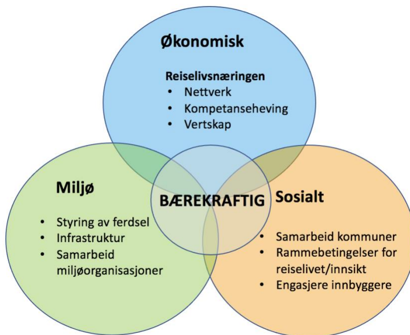
Modell 3) Oppgaver og ansvarsområder for bærekraftig destinasjonsledelse

Egenutviklet modell basert på empiriske funn og de 10 prinsipper for bærekraftig reiseliv