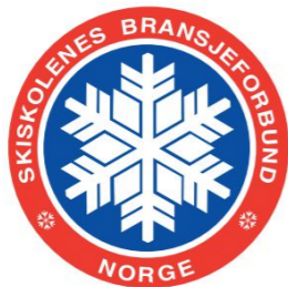
Skiskolenes Bransjeforbund Norsk Ski Akademi