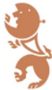
Opplysningskontoret for Terrengsykling