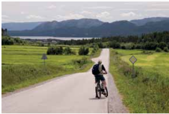
Dag1: Turen går fra Namsos til Jøa