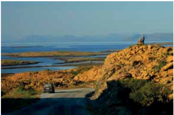
Dag 4: Leka rundt på sykkel er en spesiell opplevelse.