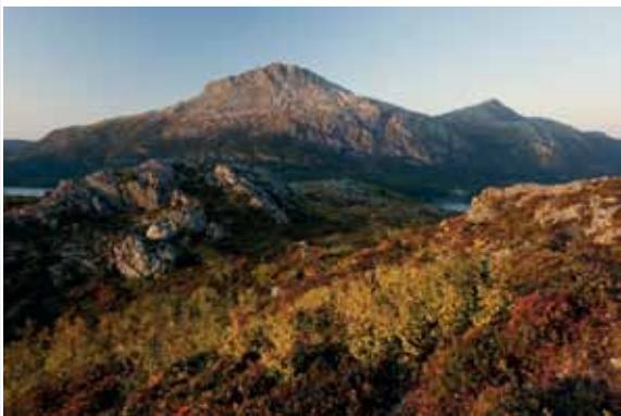
Dag 5: Du passerer rett ved utgangspunktet for vandretur til Heilhornet.