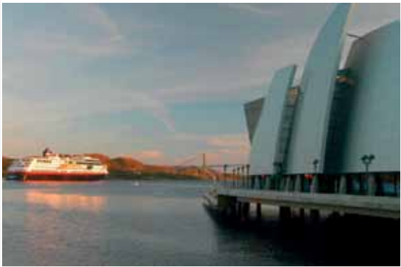
Dag2/3: Besøk kystkulturmuseet Norge i Rørvik